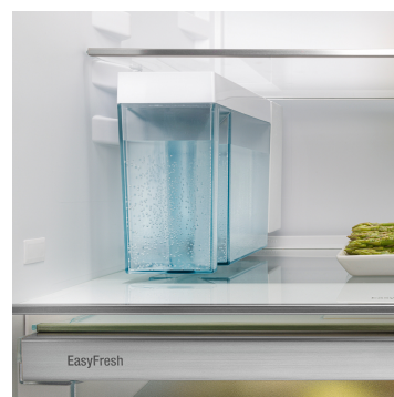
IceMaker s nádržkou na vodu

Skutočne jedinečný: Vďaka dotykovému displeju je ovládanie vašej chladničky Liebherr skutočne jednoduché a intuitívne. Na displeji sú všetky funkcie prehľadne usporiadané. Lhkým dotyk prsta poľahky napríklad zvolíte funkcie alebo skontrolujete aktuálnu teplotu vašej chladničky.