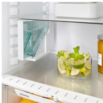
IceMaker s nádržkou na vodu

IceMaker s nádržkou na vodu ponúka inovatívne riešenie pri nedostatočnej kvalite vody resp. chýbajúcom vodovode. Kvôli plneniu sa dá pohodlne vybrať.