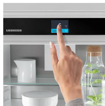
Displej Touch & Swipe

Tešte sa z optimálneho dimenzovaného vnútorného priestoru: Svetelné stĺpiky LightTower ukazujú potraviny v najlepšom svetle a sú umiestnené tak, že naplnená chladnička je vždy osvetlená na veľkej ploche. Vzhľadom na to, že stĺpiky LightTower sú integrované do povrchu bočných stien, navyše zostane dostatok miesta na potraviny.