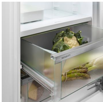
Priečinko na ovocie a zeleninu

Chrumkavý šalát alebo jahody: Najcitlivejšie potraviny si zaslúžia špeciálne miesto, aby zostali dlhšie čerstvé: priečinky BioFresh. V „BioFresh s priečinkom na ovocie a zeleninu“ panuje teplota blízko 0 °C. V kombinácii s vlhkosťou vzduchu, ktorá v ňom nepretržite panuje vďaka hermetickému uzavretiu, sa nebalené ovocie a zelenina cítia obzvlášť dobre. Nemusíte nič nastavovať.